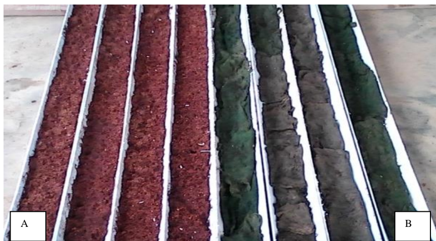
Rajah 1: Dua jenis medium tanaman yang digunakan. (A) Empat bekas penanaman menggunakan sabut kelapa dan (B) empat bekas menggunakan alga

Sumber tumbuhan yang digunakan dalam kajian ini adalah pokok sawi Brassica juncea . Sawi ditanam melalui biji benih yang diperolehi dari pasaraya tempatan di Sandakan, Sabah. Penanaman sawi dalam kajian ini melibatkan dua jenis medium tanaman iaitu sabut kelapa dan alga yang telah dikeringkan (Rajah 1). Sabut kelapa diperolehi dari peniaga kecil di pasar tempatan. Manakala alga diperolehi dari kolam terbiar di sekitar kawasan Sandakan. Alga yang dikumpul dilakukan proses pengeringan selama tujuh hari untuk memastikan alga tersebut bebas dari air yang berlebihan. Bekas yang digunakan untuk meletakkan medium tanaman ini adalah paip PVC berukuran 1.5 m panjang dan berdiameter 40 mm. Paip tersebut dibelah kepada dua bahagian untuk dijadikan sebagai bekas penanaman.