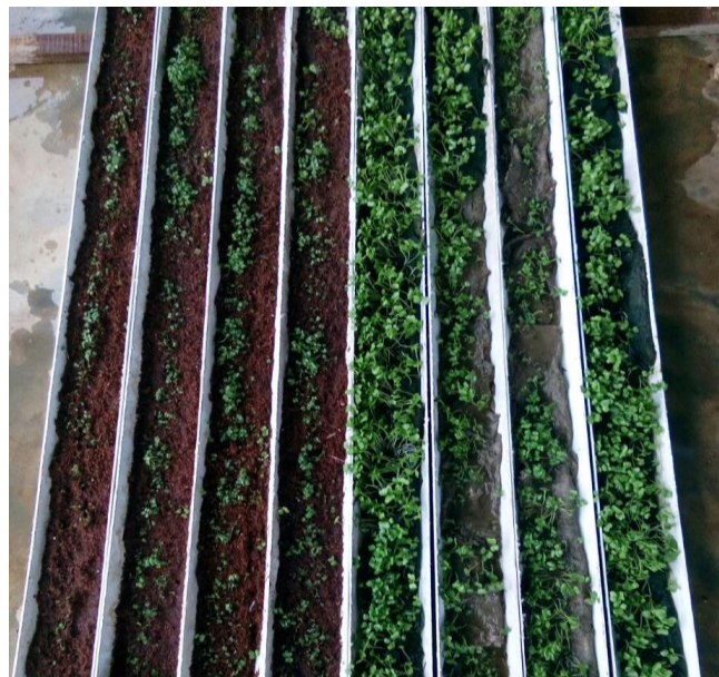
Rajah 2: Perbandingan pertumbuhan sawi menggunakan sabut kelapa dan alga.

Melalui Rajah 2, perbandingan ketara dapat dilihat pada kadar pertumbuhan pokok sawi. Sawi yang ditanam pada medium alga lebih banyak dan subur berbanding sawi yang ditanam pada medium sabut kelapa. Tindak balas tumbuhan yang mengalami kekurangan air boleh menjadi perubahan pada tahap sel dan molekul ditunjukkan dengan penurunan kadar pertumbuhan, kawasan daun berkurang dan peningkatan nisbah akar (Ai & Banyo, 2011). Hal ini membuktikan medium alga mempunyai tahap kesuburan dan pegangan air yang lebih tinggi berbanding sabut kelapa.