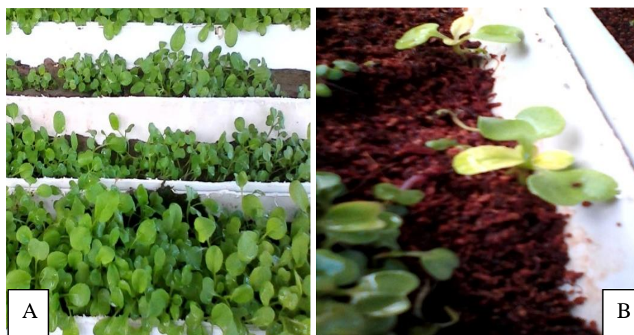
Rajah 3: Sawi yang ditanam pada medium alga (A); Sawi yang ditanam pada medium sabut kelapa (B)